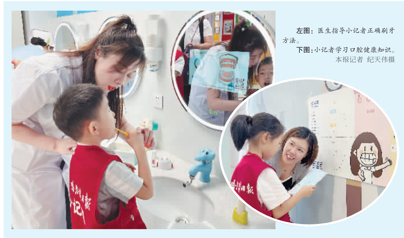
左图:医生指导小记者正确刷牙方法。

为了增强孩子们的体验感和活动的实效性,香坊区儿童口腔宣教中心设置了多个互动环节。在一楼科普区,工作人员