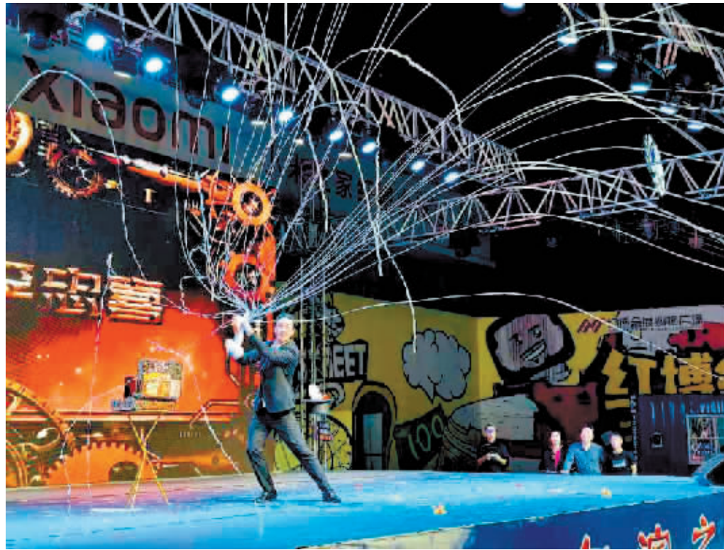
右图:精彩魔术表演现场。

南岗区文化馆负责人表示,南岗区将为市民游客提供更多高质量的公共文化服务,以创新的形式,将文化艺术融入到市民的日常生活中,为城市文旅发展增添新活力。